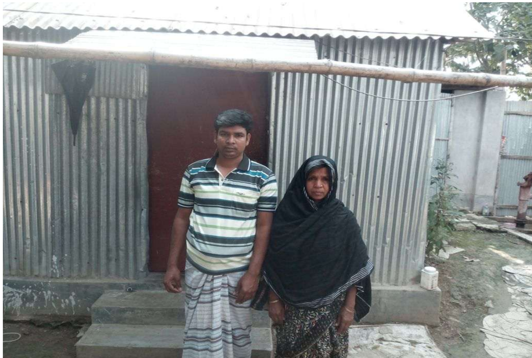
NU with his mother