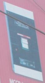
MCCB (16A - 2500A)