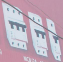
MCB (2A - 125A)